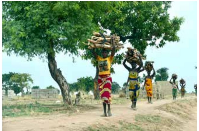
In Nigeria werden Lasten von Männern und Kindern, vor allem aber von Frauen auf dem Kopf transportiert.

16 Uhr Gottesdienst, anschließend Essen & Trinken in der Alten Bücherei.